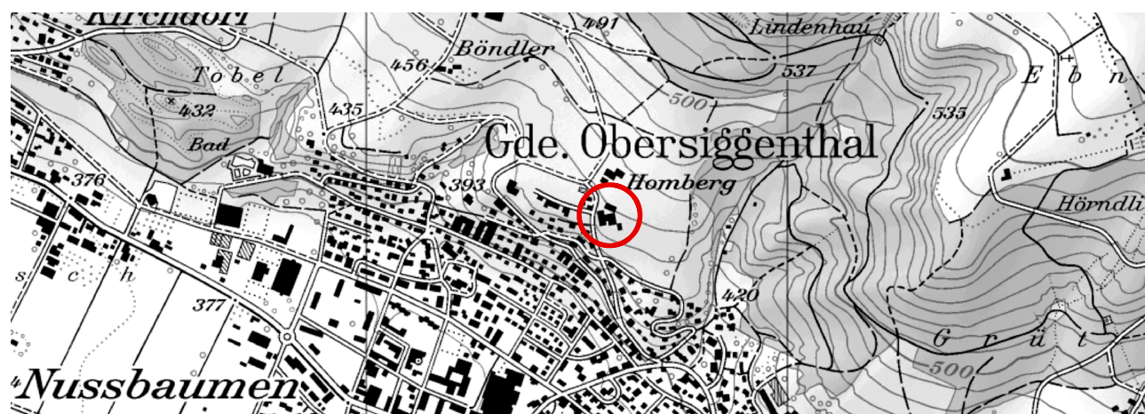
Übersichtsplan ohne Massstab

Mitwirkung vom: 11. Januar 2019 bis 11. Februar 2019