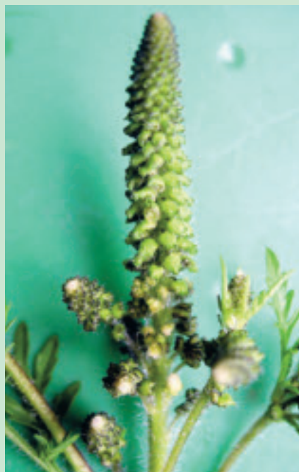
August und September ist die Hauptblütezeit, späte Pflanzen blühen bis im Oktober.