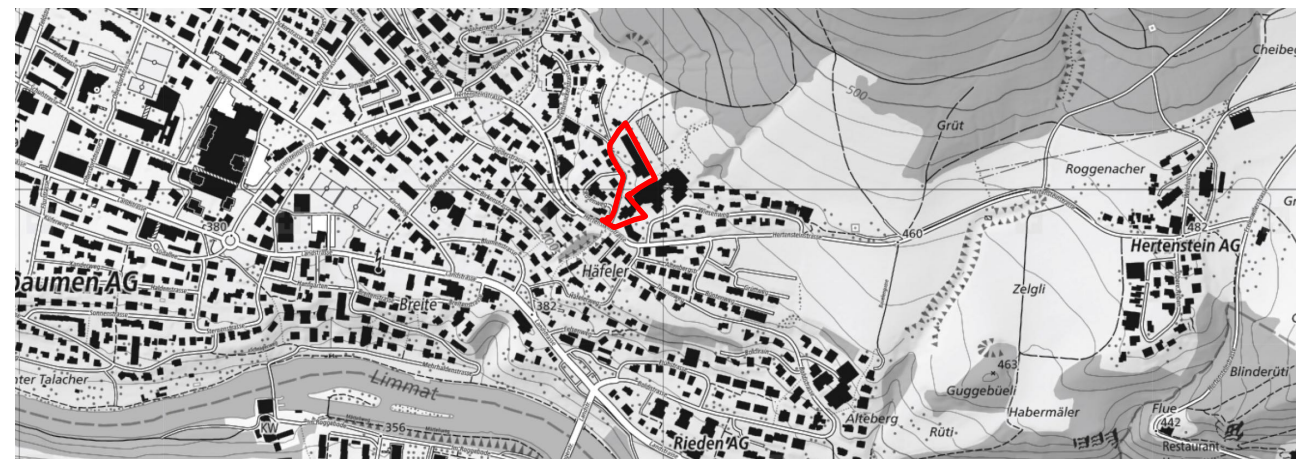
Übersichtsplan ohne Massstab