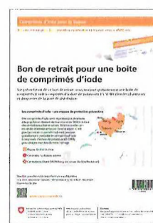
Bon de retrait

Vous recevrez des autorités communales de votre nouveau lieu de résidence un bon de retrait pour chaque membre de votre ménage. Ce bon vous permettra d'aller retirer gratuitement les comprimés d'iode dans une pharmacie ou une droguerie de la zone de distribution. Veuillez tenir compte des informations figurant sur la notice d'emballage des comprimés.